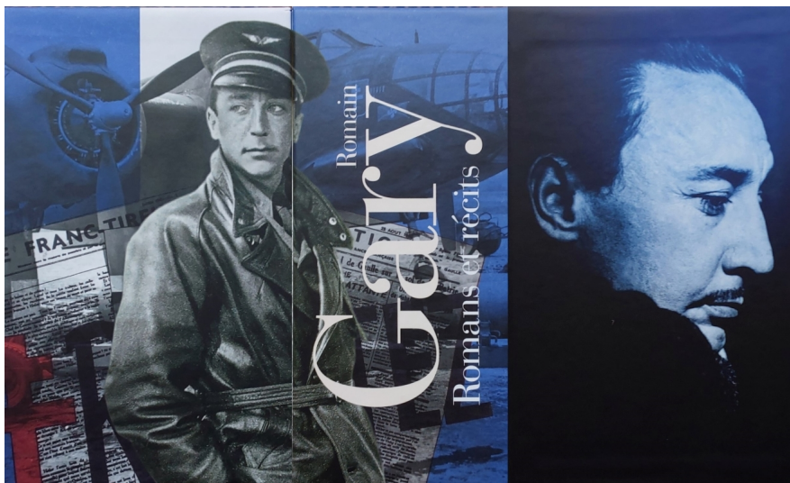
Développé du coffret 2019